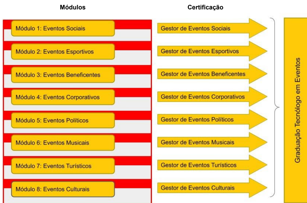
Fig. 2: Diagrama de formação curricular do curso

Almejando atingir os objetivos de certificação do Curso Superior de Tecnologia em Eventos, a Faculdade Roberto Miranda, levando em consideração o perfil do egresso e as certificações intermediárias proporcionadas, adotou a representação gráfica do perfil de formação abaixo: